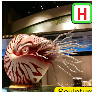
Sculpture en chocolat