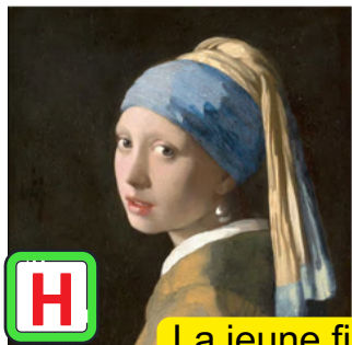
La jeune fille à la perle

Voici une série d'images : certaines ont été conçues par l'humain et d'autres ont entièrement été générées par l'Intelligence Artificielle. Sauras-tu les distinguer ? Inscris "IA" (Intelligence Artificielle) ou "H" (Humain) dans la case correspondante pour indiquer, qui selon toi, à produit l'image.